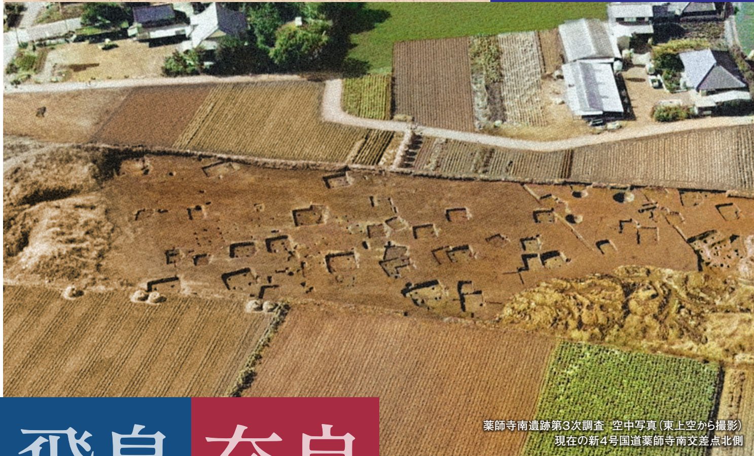
薬師寺南遺跡第3次調査 空中写真(東上空から撮影) 現在の新4号国道薬師寺南交差点北側