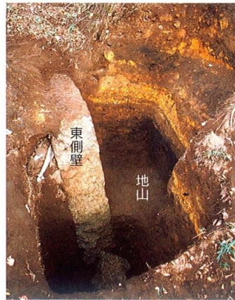
▲ 主体部の断面と掘り形