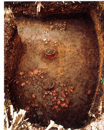
▲ 間隔が広く配置された円筒埴輪(23トレンチ)